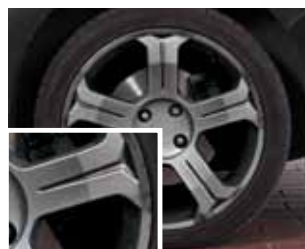
Mit Standardbelag gebremst