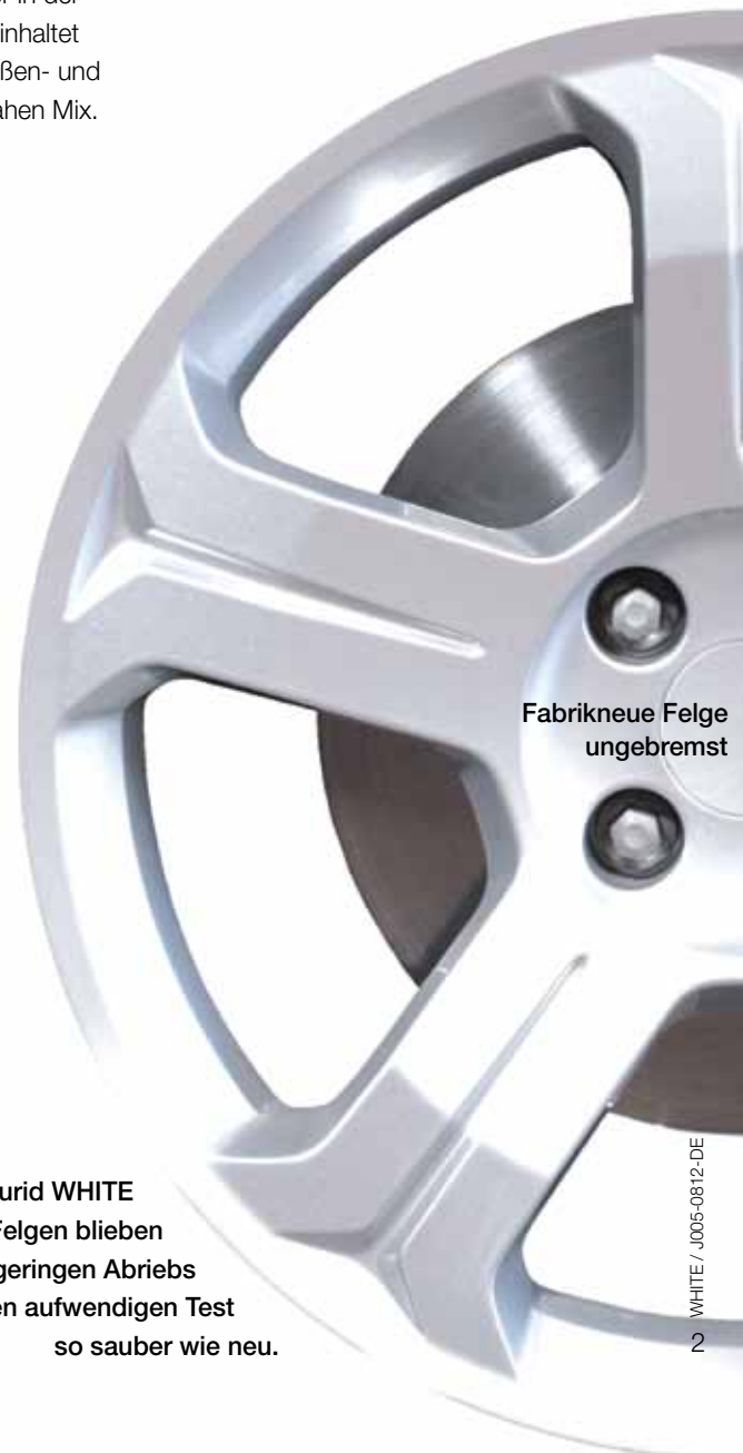
Fabrikneue Felge ungebremst

Mit Jurid WHITE gebremste Felgen blieben dank des geringen Abriebs auch nach den aufwendigen Test so sauber wie neu.