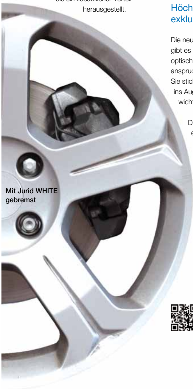
Mit Jurid WHITE gebremst

Jurid WHITE erfüllt alle Erwartungen der Kunden einer Premiummarke mit Kompetenz und Leidenschaft