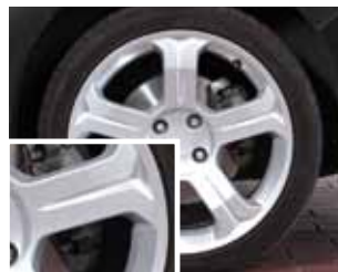
Neue Felge ungebremst