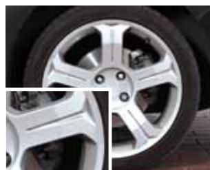
Mit Jurid WHITE gebremst